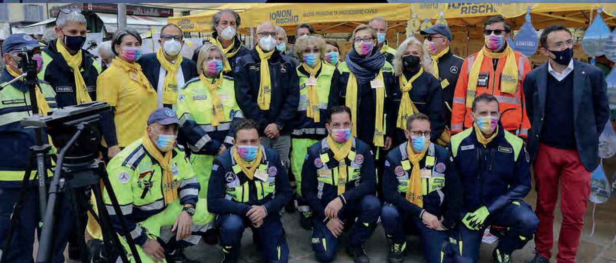
Convegni ed eventi caratterizzeranno la 'Settimana nazionale della Protezione civile', che si concluderà nelle piazze italiane con la giornata di 'Io non rischio'. Foto dell'edizione 2021