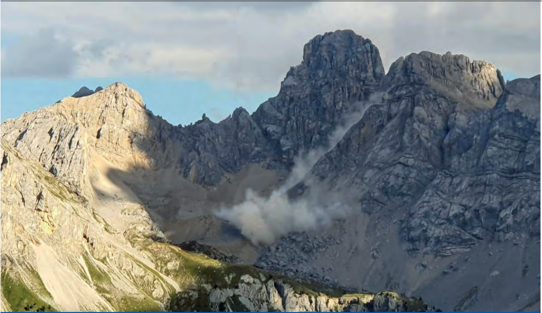
3 luglio 2022. La frana a Cima Uomo in Marmolada che costò la vita a 11 persone

lavorato per una radio e tre televisioni private e svolto diverse collaborazioni con riviste e testate varie. Non sono mancati anche incidenti di percorso tra cui il fallimento di una televisione, con le conseguenti mobilità e cassa integrazione per i collaboratori. In seguito la decisione di fare domanda all'ente pubblico che è andata bene e mi ha portato ha iniziare un percorso che fatalmente è coinciso con l'avvio della mia frequentazione della Protezione civile all'epoca del terremoto in Val Topina (Umbria).