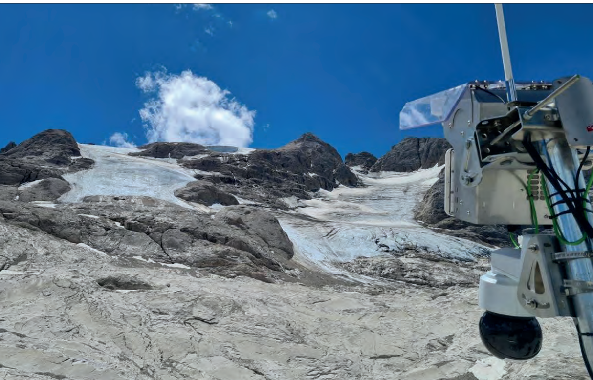
L'area del distacco con le due lingue di ghiaccio. A destra l'attrezzatura di monitoraggio

Quando posso faccio il giornalista operativo sul campo. In un certo senso è il Settore di Protezione civile stesso a costringerti e a reclamarti sugli eventi come accaduto, purtroppo, per il tragico evento della Marmolada.