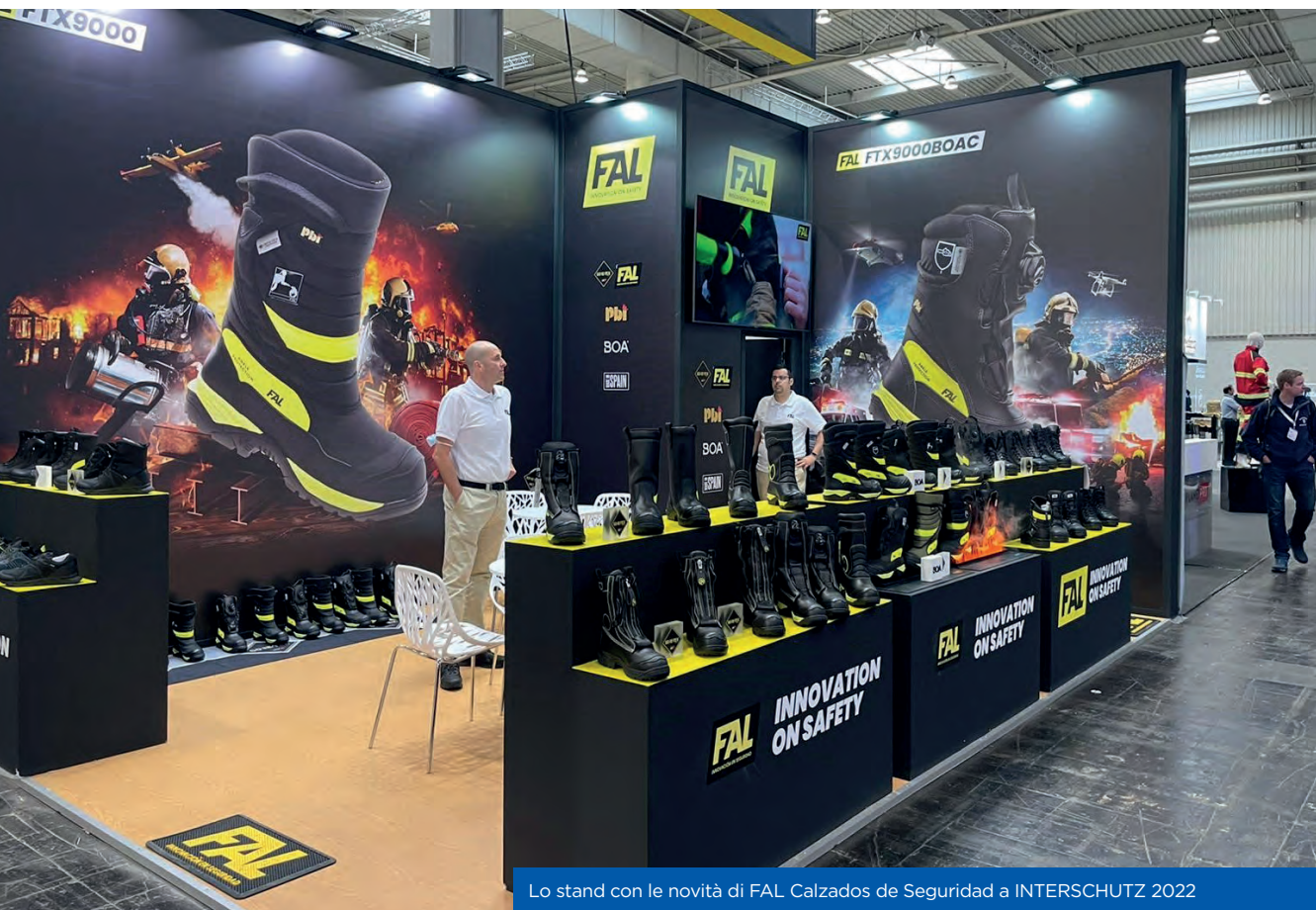
Lo stand con le novità di FAL Calzados de Seguridad a INTERSCHUTZ 2022

stivale, aspetto di vitale importanza nei lavori di soccorso e antincendio, dove la capacità di muoversi liberamente e comodamente senza ridurre la protezione è essenziale.