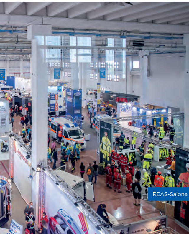
REAS-Salone internazionale dell'Emergenza: panoramica di uno dei padiglioni