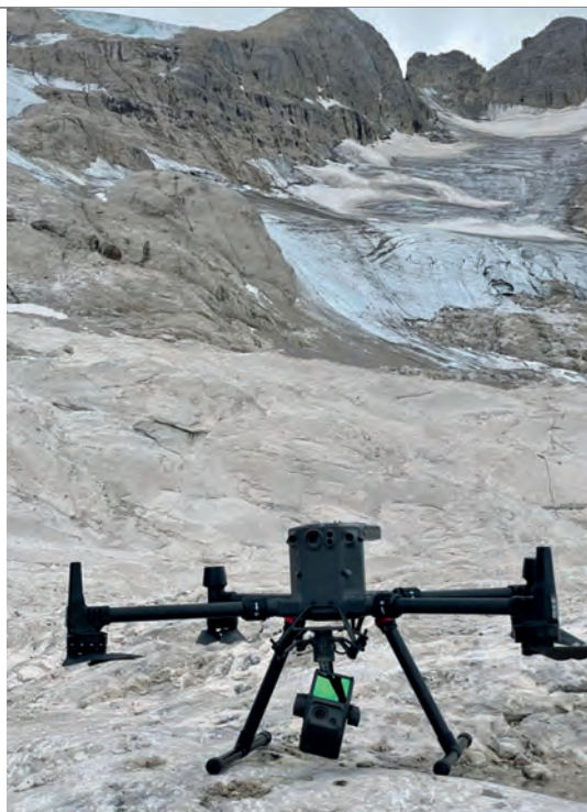
Uno dei 2 droni impiegati nelle operazioni di ricerca sul ghiacciaio della Marmolada

di autenticità. Ciò non significa che chi parla in questo momento o l'editore che io servo tra virgolette abbiano in mano la verità, ma se hanno ben chiaro l'onestà intellettuale e anche un certo sapere di come vanno le cose nel mondo, cercheranno comunque di tenere la barra dritta perché poi i nodi verranno comunque al pettine. La correttezza, la serietà e l'impegno devono essere al primo posto e credo che il cittadino, anche criticandoci, percepisca questi valori.