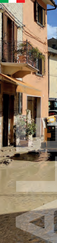
Volontari all'opera a Cantiano (PU)