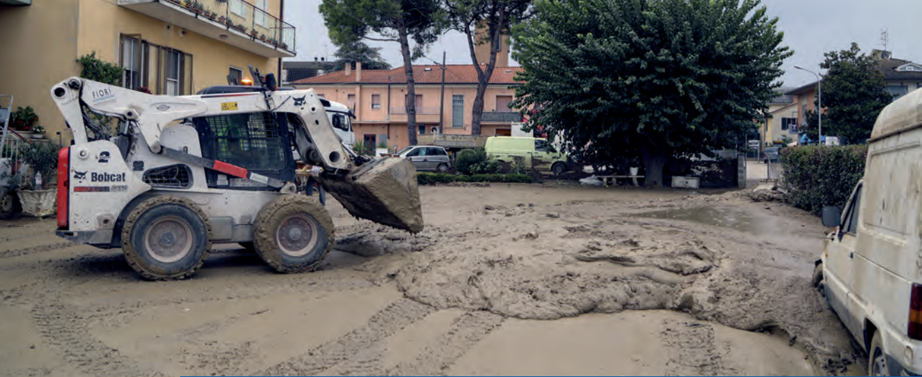
Alluvione Marche, 15/16 settembre 2022. Interventi della Protezione civile a Ostra (AN)