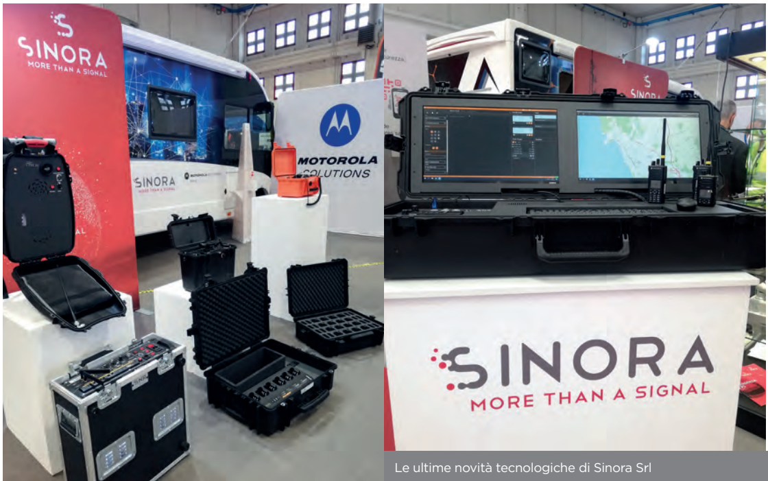
Le ultime novità tecnologiche di Sinora Srl

per esempio, all'operatività della Protezione civile o della Croce Rossa Italiana a seguito di un'alluvione piuttosto che un terremoto. In questi particolari scenari occorre intervenire tempestivamente, usufruendo di una rete radio che possa essere attivata in un contesto nomade, con apparati facilmente trasportabili,