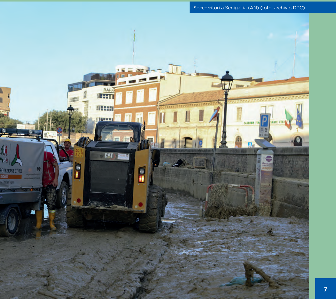
Soccorritori a Senigallia (AN)