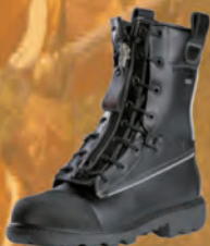
K802 Fenix Plus