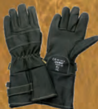
K807 Guanto Tornado

Tecnologie del futuro per la sicurezza di oggi Future technology for today's safety