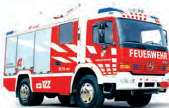
AT 2 (Alluminium Technology)