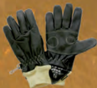
K805 Guanto Ciclon