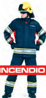
FIRE MAX II