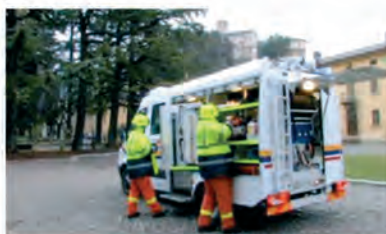
YAK 65 Veicolo Polisoccorso Antincendio