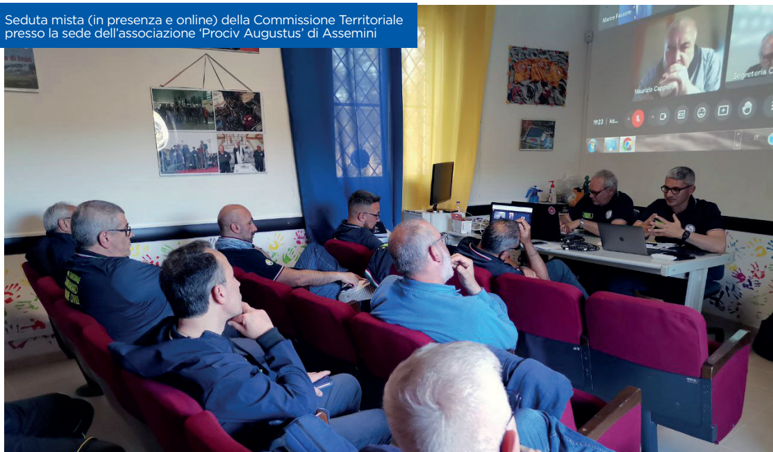
Seduta mista (in presenza e online) della Commissione Territoriale presso la sede dell'associazione 'Pro Civ Augustus' di Assemini