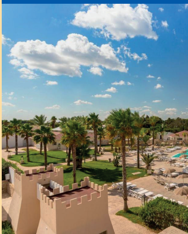
Resort 'Barone di Mare' a Melendugno in località Torre dell'Orso - Salento (LE)

Situato a 1 km circa da Torre dell'Orso, il Resort, recentemente ristrutturato, si compone di una serie di unità residenziali a schiera su due livelli,