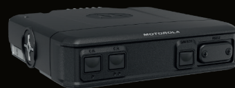
Radio veicolare MXM600