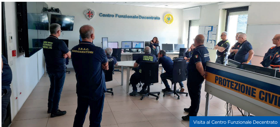
Visita al Centro Funzionale Decentrato