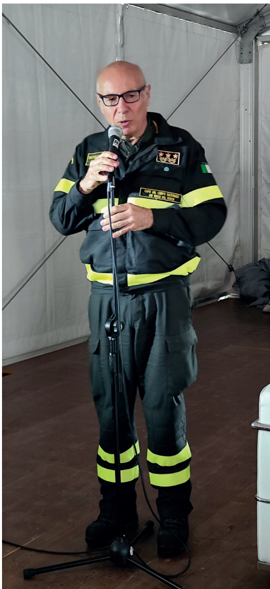
L'intervento dell'Ing. Carlo Dall'Oppio, Capo del Corpo Nazionale dei Vigili del Fuoco